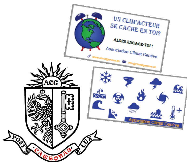
Etiquettes et tatoos Alternatiba