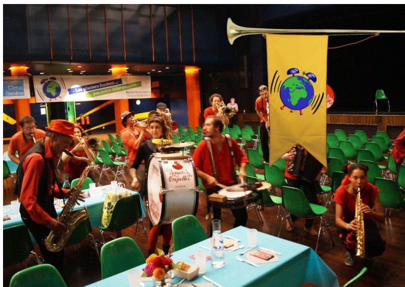
Soirée de soutien 17.10.2018, les hérauts du climat