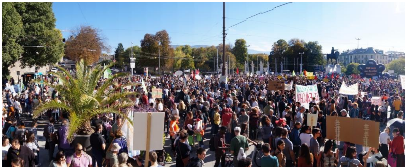
La marche climat du 13 octobre 2018 à la place neuve

Comptes détaillés : voir le rapport du trésorier