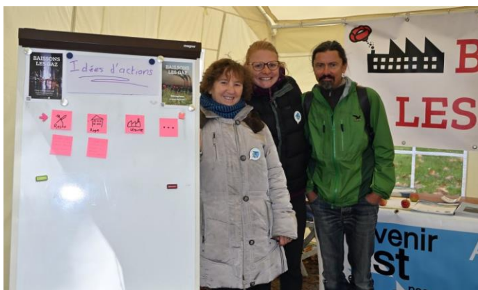
Le stand Alternatiba