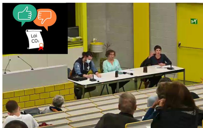
Conférence sur la loi CO 2

L'ACG soutient la loi CO 2 , comme première étape qui devra urgemment être complétée par d'autres mesures. Voir le FAQ pour plus d'infos : https://climatgeneve.ch/docs/loico2_faq.pdf