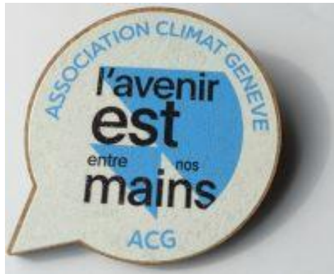
Le nouveau badge ACG