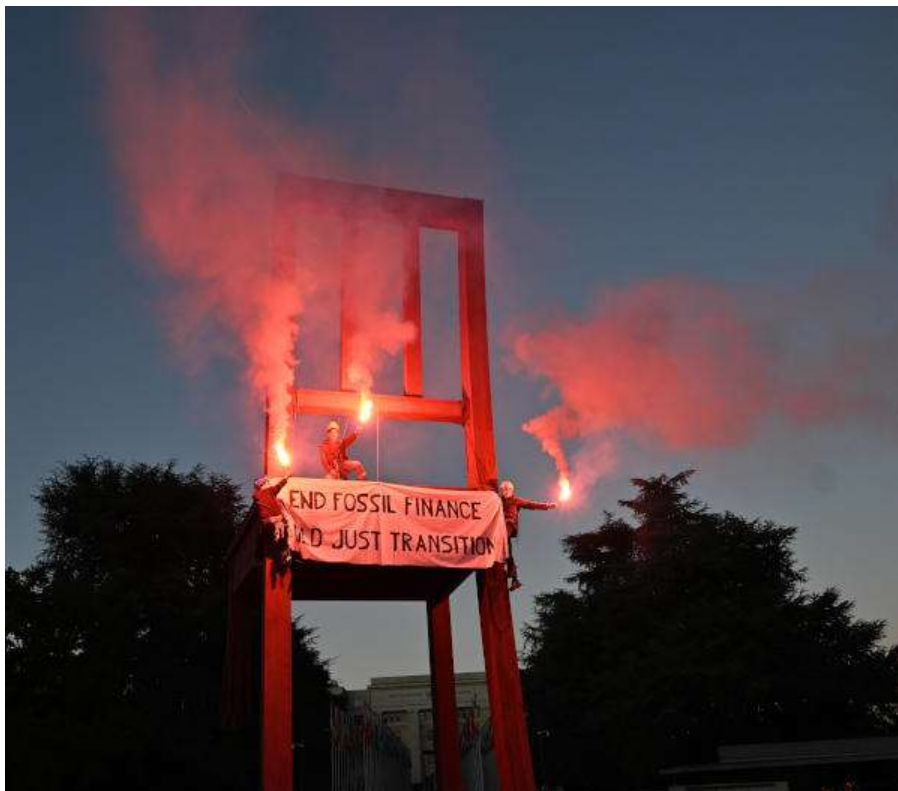
Manifestation du 22 octobre 2021